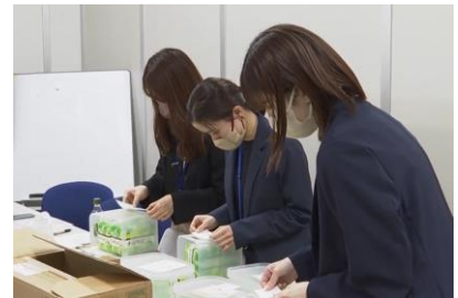
生理用品設置の様子