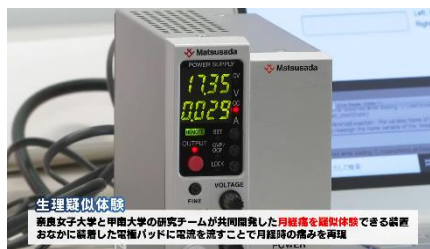
生理痛を再現する電流の装置

※ニュースリリースに記載している情報は、発表日時点のものです。現時点では、発表日時点での情報と異なる場合がありますので、あらかじめご了承くださいとともに、ご注意をお願いいたします。