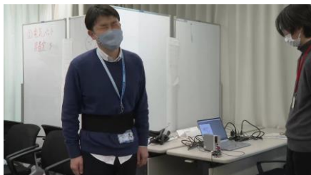
男性社員が生理痛疑似体験をする様子

「SHINING 活動」で行った社内アンケートでは、生理休暇の取得者は7%にとどまり、83%の女性社員が生理休暇を取得しづらいと回答。そこで生理休暇を取得しやすい職場環境づくりに向けた施策案を策定し、その一環として男性社員の生理への理解を深めてもらうため、NTT フィールドテクノのマネジメント層の男性社員を対象に、生理痛を疑似体験できる装置を使った生理体験を2023年3月に実施しました。